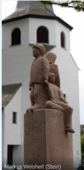
Markus Weisheit (Stein)