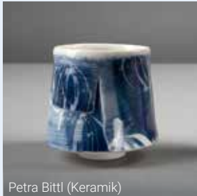
Petra Bittl (Keramik)