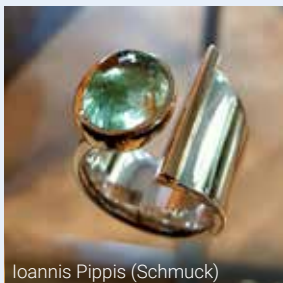
Ioannis Pippis (Schmuck)