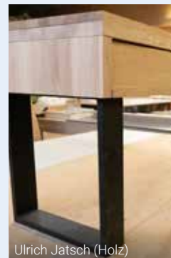
Ulrich Jatsch (Holz)