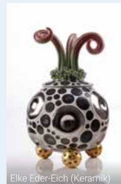
Elke Eder-Eich (Keramik)